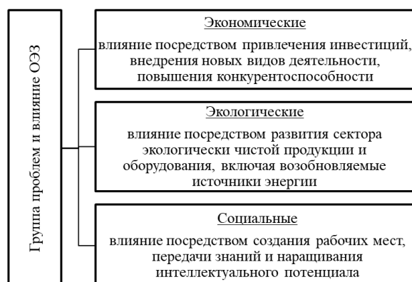
Рисунок 2 – Влияние особых экономических зон (ОЭЗ) на решение региональных проблем [3]

Общая концепция, лежащая в основе особых экономических зон, заключается в предоставлении определённых привилегий экономическим субъектам на их территории при условии, что они будут участвовать в любой форме международной деятельности. Предлагая такие привилегии, страны рассчитывают "подтолкнуть" развитие определённых регионов, получающих выгоды от свободных зон для решения своих социально-экономических проблем и внутреннего экономического роста. Грамотное использование потенциальных выгод позволяет влиять на решение региональных экономических, экологических и социальных проблем (Рис. 2). Например, на решение первой группы проблем оказывает влияние возникающее повышение конкурентоспособности на экспортном рынке, достижение экономического разнообразия за счёт внедрения новых видов деятельности и секторов, увеличение валютных поступлений.