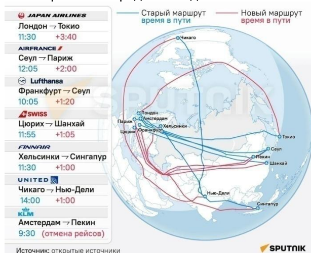
Рис. 3 – Данные об изменении длительности и полётного расстояния при закрытом небе Российской Федерации и Украины

Помимо вышеперечисленного, начавшийся в феврале 2022 г. конфликт между Россией и Украиной также привёл к сокращению туристских поездок. Введённые санкции и закрытое небо над некоторыми странами привели к увеличению времени полётов, повышению стоимости авиаперелётов. Представим данные об этом на Рис. 3.