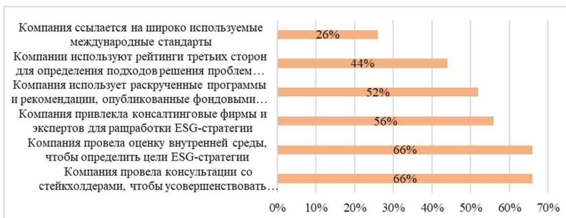
Рисунок 3 – Подходы китайских компаний для интегрирования ESG-принципов

Опираясь на диаграмму, важно осознавать риски потери интереса со стороны спонсоров к организации. Китайский опыт отличается от общемирового тем, что предприятия постепенно осознают действительные причины внедрения ESG-модели. Несмотря на то, что большинство организаций ориентированы на экологическую повестку и следуют преимущественно социально-культурным и экономическим трендам, нежели ориентируются на собственные потребности и формируют стратегию под конкретные проблемы и перспективы, сравнивая свой опыт с конкурентным, некоторые представители китайского рынка всё же меняют принципы применения ESG-модели. Статистические данные на Рис. 3 подчёркивают тот факт, что значение внутренних "слабых сторон" организаций, возможностей и рисков расценивается иначе, так как теперь характеризуется как одна из базовых "опорных точек" при внедрении ESG-концепции и её раскрытия с учётом внутренних особенностей компаний (66%), располагаясь на одной позиции с мнением стейкхолдеров. Опыт китайских организаций отражает весомость рисков потери инвестиций и места на рынке при нецелесообразном использовании ESG-модели, опираясь лишь на общественные тренды.