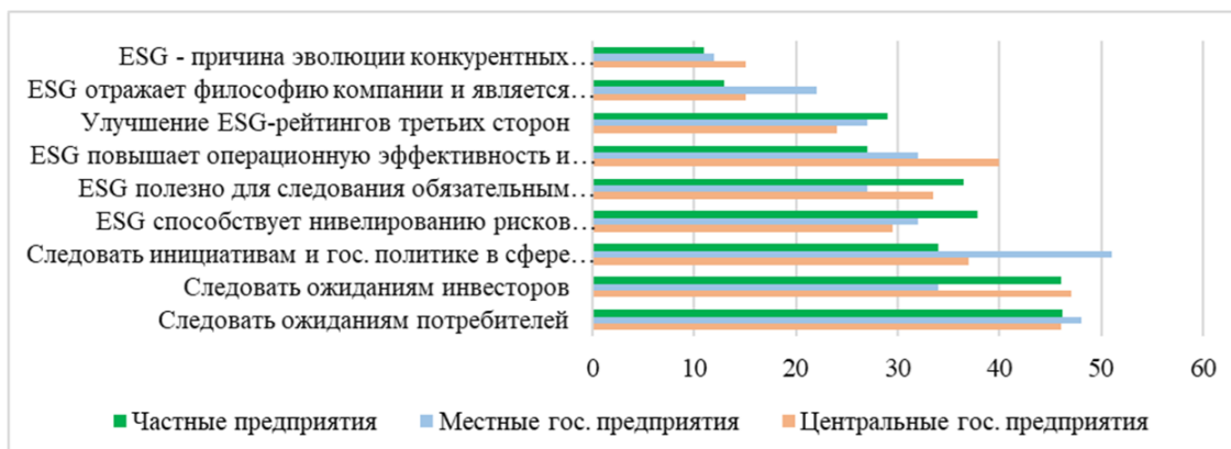
Рисунок 2 – Потребительские и инвесторские ожидания от внедрения ESG-стратегии на предприятиях