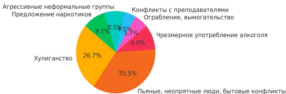
Рисунок 5 – Основные опасные ситуации в повседневной жизни

На вопрос об определении регулярности проявления опасных ситуаций в повседневной жизни ответы были разноплановы, их результат представлен на Рис. 5.