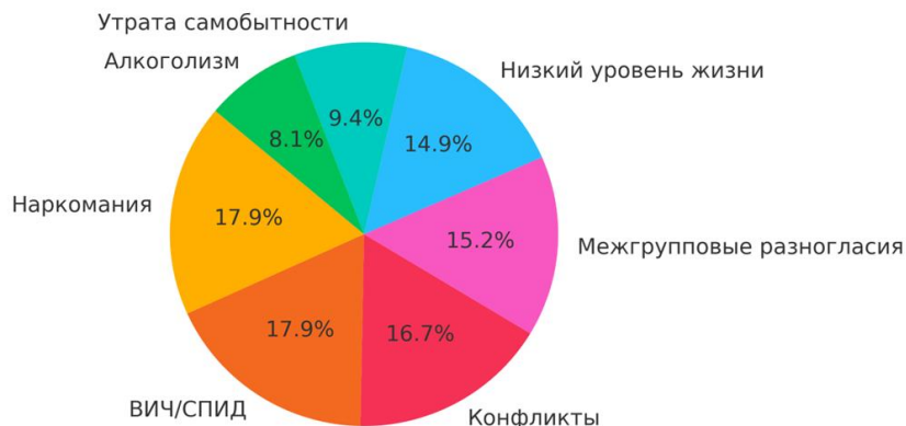
Рисунок 4 – Основные угрозы, влияющие на безопасность

Результаты ответов опрошенных студентов на вопрос анкеты "Назовите основные угрозы социального характера", представленные на Рис. 4, распределились следующим образом.