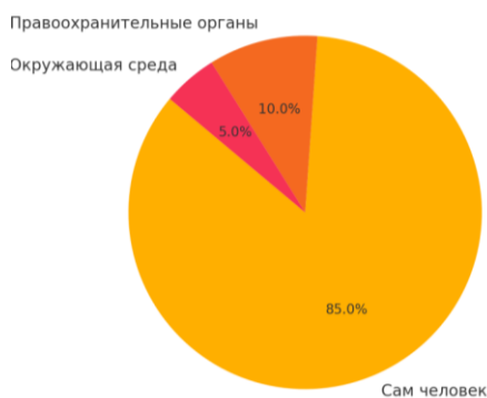
Рисунок 2 – Факторы, влияющие на безопасность

Большинство студентов первого курса полагают, что безопасность человека в окружающей их социальной среде в основном зависит от самого человека, что представлено на Рис. 2.